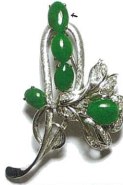
Only one piece tested 簡咀所示為經鑑定之物件

Shape and Cut: Oval-shaped cabochon (top) 形狀及琢型 且形(頂) Dimensions (mm): Approx. 約 9.48 x 5.98 x 1.74 尺寸 Weight (ct): 45.44 including mounting 重量 重量包括鑲托 Transparency: Translucent 半透明 透明度 Colour: Bright green 鮮綠 顏色 Infrared Spectrum: No resin is detected 紅外線光譜 沒有發現樹脂