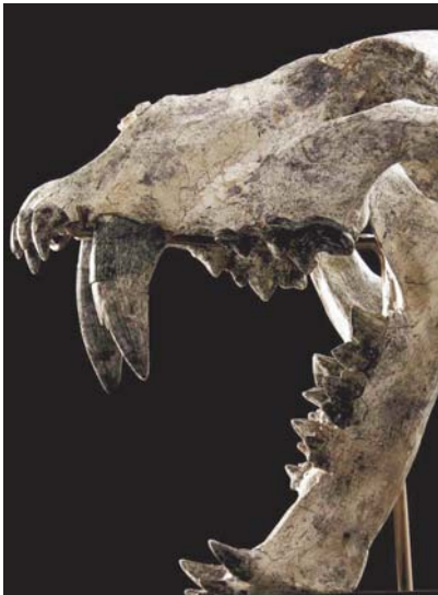
Crâne de Tigre à dent de sabre (-23 millions à -1, 75 million d'années) d'années Estimation : €35.000-45.000

Paris – Suite à l'immense succès rencontré l'année dernière lors de la vente d'un cabinet de curiosités qui avait totalisé plus d'un million d'euros et établis douze records du monde, Christie's propose à nouveau une vente de cette spécialité le 16 avril. Ce n'est pas un simple cabinet de curiosités mais un véritable musée éphémère d'Histoire Naturelle, qui sera reconstitué avec plus de 150 pièces exceptionnelles, provenant pour la plupart de collections privées.