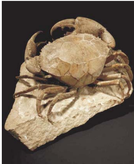
Crabe Harpactocacinus Quadrilobatus (- 53 millions à - 33 millions d'années) Estimation : €1.000-1.500