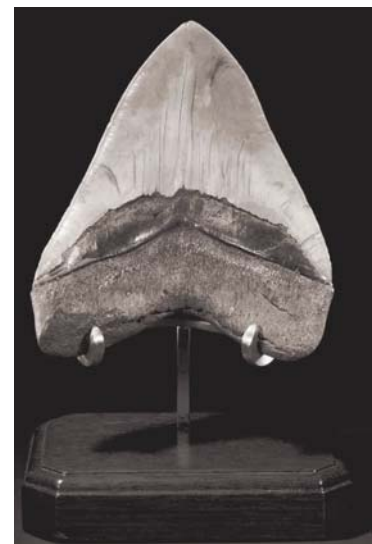
Dent de requin géant (15.5 cm) (-23 millions à -5, 3 millions Estimation : €3.500-4.000

Le catalogue de cette vente propose un voyage unique dans le temps remontant à 450 millions d'années avant notre ère (les trilobites sont les fossiles les plus anciens) jusqu'à nos jours (végétaux). Un chapitre spectaculaire est consacré aux dinosaures (-65 millions d'années) et à la dispersion des collections de 3 grands esthètes.