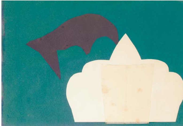
Alexei Krutchenykh, Olga Rozanova Vselenskaia Voïna (la guerre universelle) Collages en couleur Petrograd : sans nom d'éditeur, 1916 Estimation : €90.000-130.000