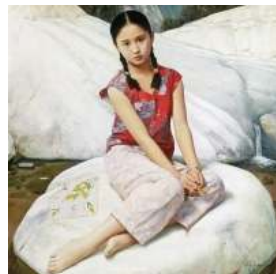
王沂東 (生於 1955 年) 《靜靜的河谷》 油彩 畫布 1997 年作 估價： 港幣 2,000,000 – 3,000,000 美元 256,400 – 384,600