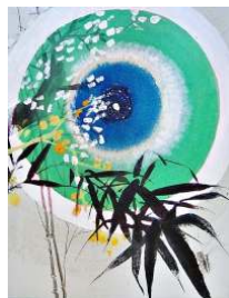
趙春翔(1913-1991) 《春》 綜合媒材 畫布 1976 年作 估價： 港幣 300,000 - 500,000 美元 38,500 - 64,100