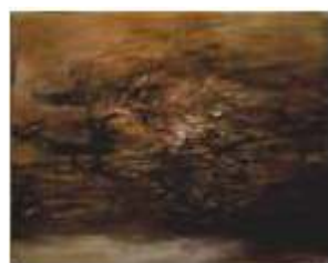
趙無極 (生於 1920 年) 《02-01-65》 油彩 畫布 1965 年作 估價： 港幣 8,000,000 - 12,000,000 美元 1,025,600 - 1,538,500

本季春拍將特別呈獻趙無極一系列創作，從 1950 年代的靜物風景、1950 年代中期開始的甲骨文字抽象作品，一直延伸至 1970 年代空靈輕淡的水墨式油畫及 1980 至 2000 年間的色彩深度性探索。在各個時期，佳士得都蒐羅了三至四件的精品，作品之間互相呼應，展現獨特的創作脈絡，完整地呈現了一個中國藝術大師半個世紀的探索歷程和藝術成就，也具體說明了中國現代繪畫承先啓後的重要轉變。 更多趙無極的拍品資訊可在此處下載