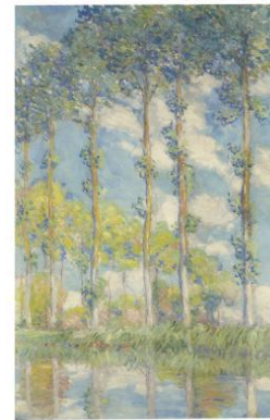
克劳德·莫奈 (1840-1926) 白杨 1891 年作 成交价: 13,489,500 英镑/ 22,482,500 美元

伦敦/纽约/香港 – 领军全球艺术市场的佳士得国际于今天宣布其 2011 年上半年全球成交总额高达 20 亿英镑 / 32 亿美元，以英镑计算较去年 17 亿英镑的成交总额（数字已包括买家佣金）增长了 15%。在欧洲大陆与英国，拍卖成交总额共计 8.034 亿英镑（13 亿美元），以英镑计算较 2010 年上半年增长 24%；美洲成交总额共计 5.777 亿英镑（9.416 亿美元），以英镑计算下跌 13%；亚洲成交总额共计 2.96 亿英镑（4.825 亿美元），以英镑计算增长 48%；中东成交总额共计 660 万英镑（1080 万美元），以英镑计算增长 10%。成交总额中的 2.867 亿英镑 / 4.673 亿美元来自私人洽购，以英镑计算较 2010 年同期增长 57%。