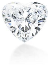
未镶嵌 56.15 克拉心型钻石 成交价: 6,740,715 英镑/ 10,946,422 美元