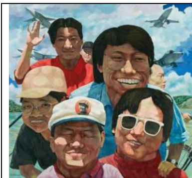
岳敏君(生于 1962 年)

「新中国的自画像」说明本次专拍私人收藏的核心概念及价值意义。艺术家的自画像刻划出每个个体的生活历练，放在历史背景中加以审视，投射出这个世代面对急遽变迁下艺术家的精神状态，阐述着中国在特定历史时空的时代特征。这些具时代意义的脸谱，可视为大时代的缩影及「新中国」世代的表征。