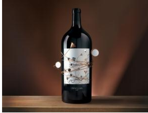
(圖為 2008 年 Ornellaia - Vendemmia d'Artista: 'L'Energia' )