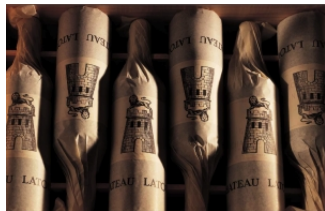
1961年拉图庄(Château Latour) 12瓶