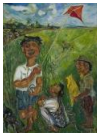
Sudjana Kerton (印尼, 1922 – 1994)