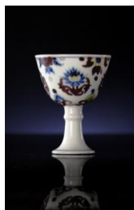
明成化 斗彩团莲纹高足杯 六字楷书横款