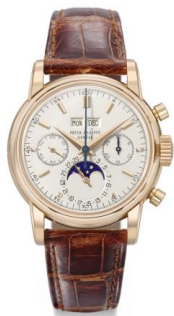
百达翡丽，精致罕有，红金，万年历，月相，手动上弦，计时码表，型号 2499，第三系列，1971年制