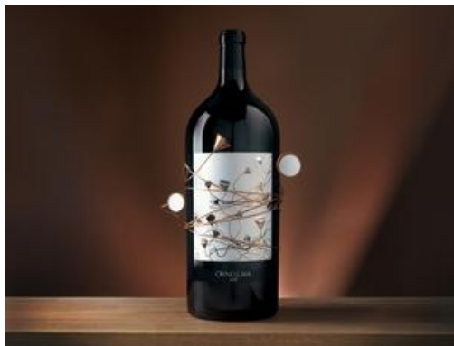
(圖為2008年 Ornellaia - Vendemmia d'Artista: 'L'Energia' )