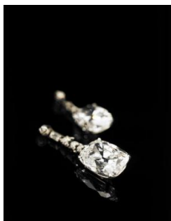
The Imperial Cushions

23.49及23.11克拉枕形戈爾康達D/VVS1(可成完美) Type IIa鑽石耳墜