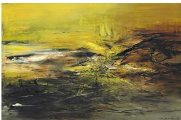
趙無極 (生於 1920 年)

本季春拍【亞洲當代藝術】將呈獻劉野創作於1999年的經典大型畫作《Bleah!》，此作品標誌着藝術家在繪畫創作的轉捩點。1990年代中期當劉野從歐洲學成歸來，鮮見於早期作品的紅色逐漸在他的畫作中佔據主導地位，並開始以幾何圖形來刻劃畫面和場景。在《Bleah!》中，他更以對稱的構圖來塑造出心目中的理想世界。此畫作的名稱「bleah」是一個感歎詞，有如兒童在看到某些厭惡的人與事時所發出的哭聲。然而，畫中三個天真無邪的孩子卻伸出了舌頭，難以看出任何明顯的情感。雖然《Bleah!》看似是一個無傷大雅的戲謔畫面，實際上卻蘊含了發人深思的寓意。在這個童話式的場景中，《Bleah!》充份描繪了內在與外在的各種關係，並同時暗示了個人的心理維度，表達了一種對外界現實不確定和焦慮的情緒。