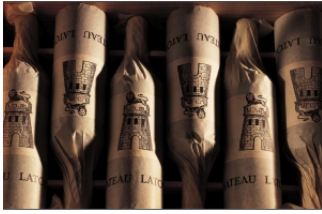
1961年拉圖莊(Château Latour) 12瓶