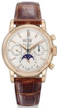
百達翡麗，精緻罕有，紅金，萬年曆，月相，手動上弦，計時碼表，型號 2499，第三系列，1971 年制