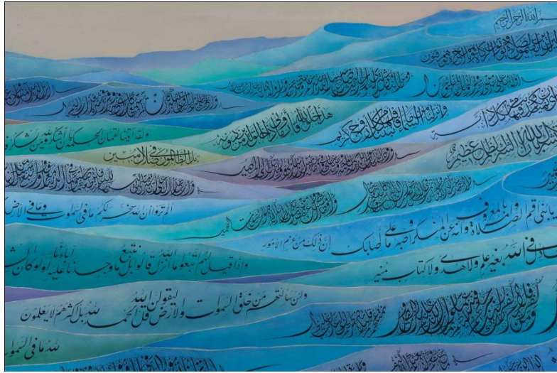
لوحة «سورة لقمان» للخطاط الياباني المسلم فؤاد كوئيبيشي هوندا (وُلد 1946)؛ قيمتها التقديرية 35,000-45,000 دولار أمريكي تبرّع باللوحة «متحف الفنون الإسلامية» بماليزيا دعماً لـ«كلية الأمير تشارلز للفنون التقليدية» اللندنية

رَبِّع ستة أعمال سيذهب لدعم «مؤسسة قزوين للفنون» فيما سيذهب رَّبِّع سبعة أعمال أخرى لدعم «كلية الأمير تشارلز للفنون التقليدية»