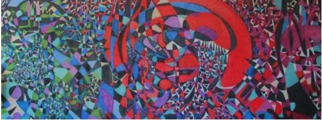
لوحة Break of the Atom and Vegetal Life للأميرة فخر النساء زيد، 1962

موسم مزادات كريستيز الخامس عشر في دبي: 24-30 أكتوبر 2013 برعاية «زيورخ»