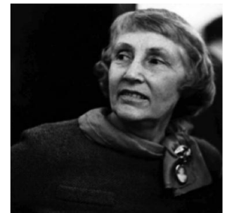
Martha Jackson, Mai 1960.