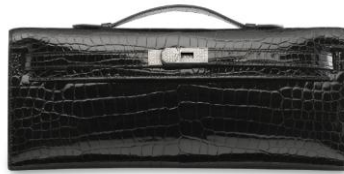
珍稀亮面黑色 POROSUS 鳄鱼皮钻石 KELLY CUT 包 附 18K 白金及钻石配件