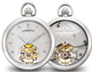
江诗丹顿 极精细及罕有，18k 白金怀表，配 陀飞轮，“Les Complications”，1980 年制

1,000,000-1,200,000 港元 125,000 150,000 美元