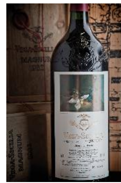
Vega Sicilia Unico 1962 Ribera del Duero