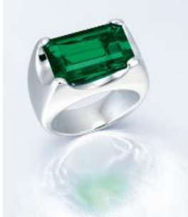
10.11 克拉哥伦比亚天然祖母绿戒指

8,000,000-12,000,000 港元 1,000,000-1,500,000 美元