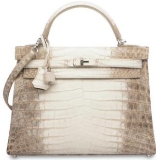
罕见雾面白色喜马拉雅尼罗鳄鱼皮 32 公分 RETOURNÉ 凯莉包附钯金配件