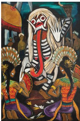
钟泗滨 (1917 年 至 1983 年) 《峇里舞会》

油彩画布 1953 年作 134 x 87.5 cm. (52 3/4 x 34 3/8 in.)