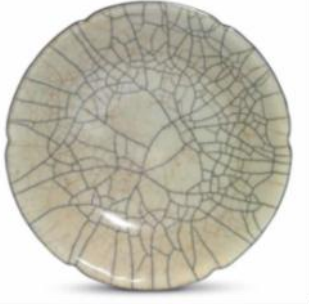
南宋 哥窑葵口盘 5 1/2 in. (14 cm.) diam.