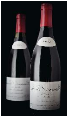
Domaine Leroy, Romanée St. Vivant 1998