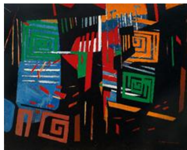
陈文希 (1906 年至 1992 年) 《海宫》

油彩画布 约 60 年代末-70 年代初作 80 x 100 cm. (31 1/2 x 39 3/8 in.)