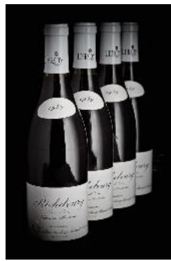
Maison Leroy, Richebourg 1959 Leroy Richebourg