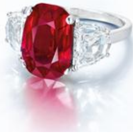
5.56 克拉缅甸天然红宝石及钻石戒指

8,000,000-12,000,000 港元 1,000,000-1,500,000 美元