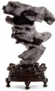
清乙卯年 (1735) 高凤翰题灵璧赏石 22 1/2 in. (57 cm.) high

2,000,000-3,000,000 港元 250,000-375,000 美元