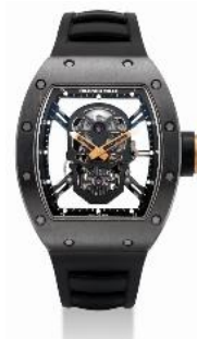
RICHARD MILLE 精细及非常罕有，黑色 TZP 陶瓷及 碳，镂空“颅骨陀飞轮”腕表，亚洲 限量生产，编号 05/06，型号 RM052，约 2014 年制

1,000,000-1,200,000 港元 125,000 150,000 美元