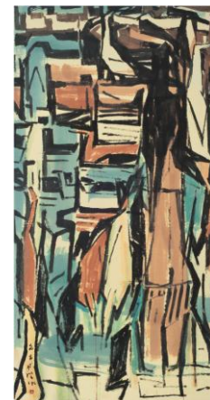
陈文希 (1906 年至 1992 年) 《聚》

5,000,000 - 7,000,000 港元 641,000 - 897,400 美元