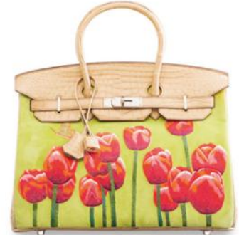
罕见、特别订制郁金香 VEAU DOBLIS 鹿皮、小马毛及雾面 POUSSIÈRE 色 POROSUS 鳄鱼皮 35 公分 铂金包附钯金配件