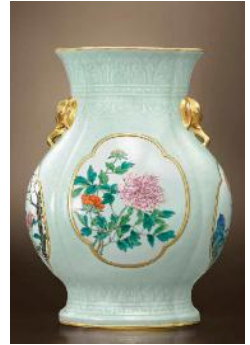
清乾隆 粉青地粉彩开光四季花卉纹 象耳海棠式壶 六字篆书款 高 14 3/4 寸 (36.2 公分)