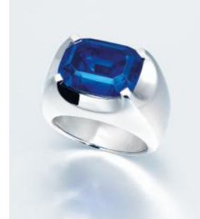
18.08 克拉缅甸天然蓝宝石戒指

12,000,000 - 18,000,000 港元 1,500,000-2,300,000 美元